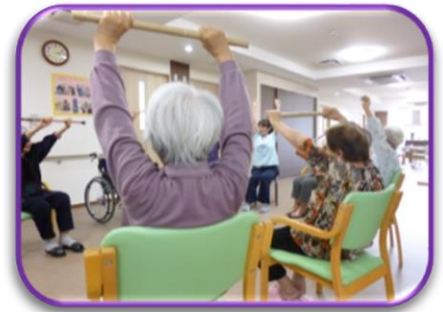
レクリエーション風景